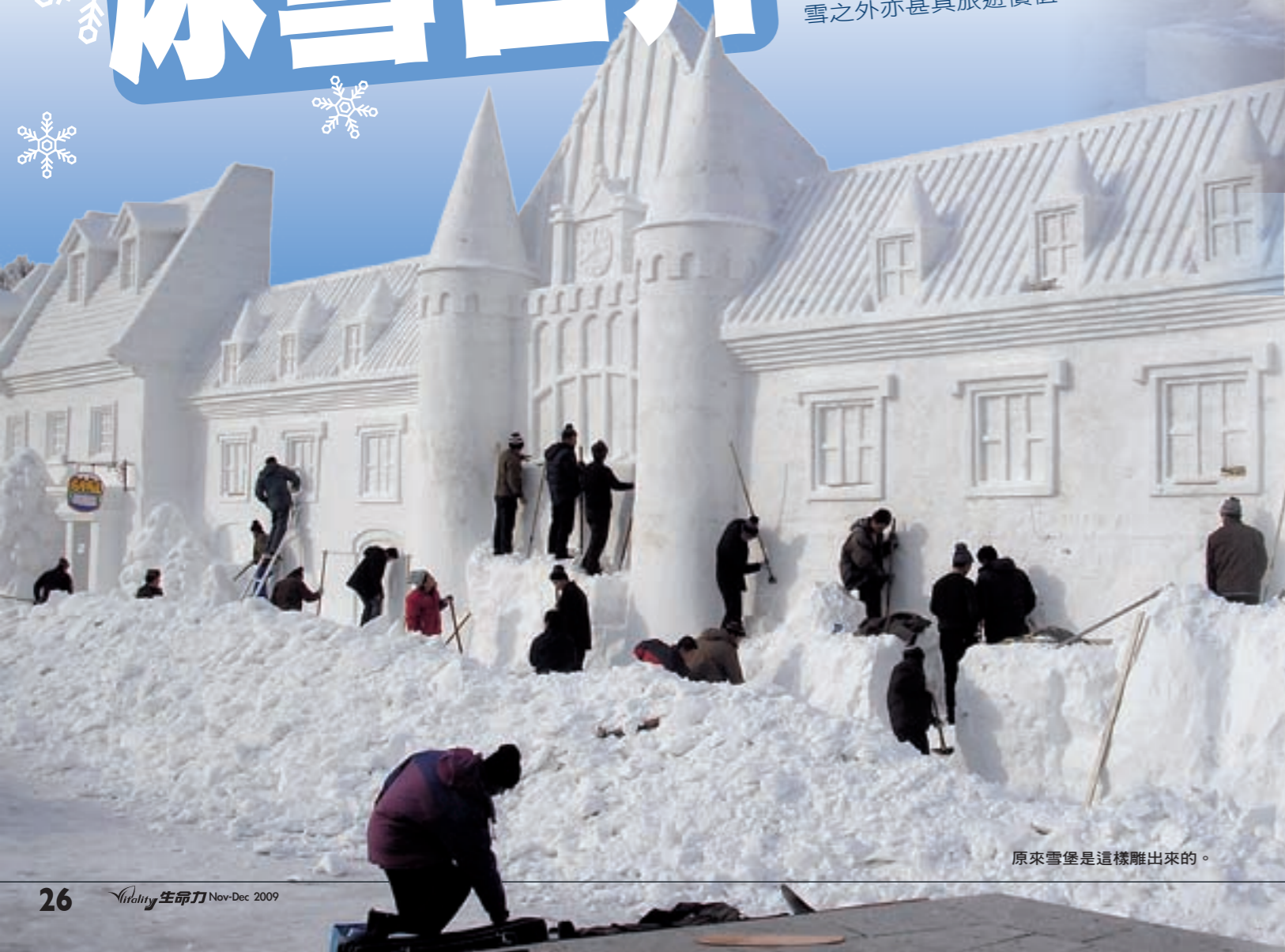
原來雪堡是這樣雕出來的。