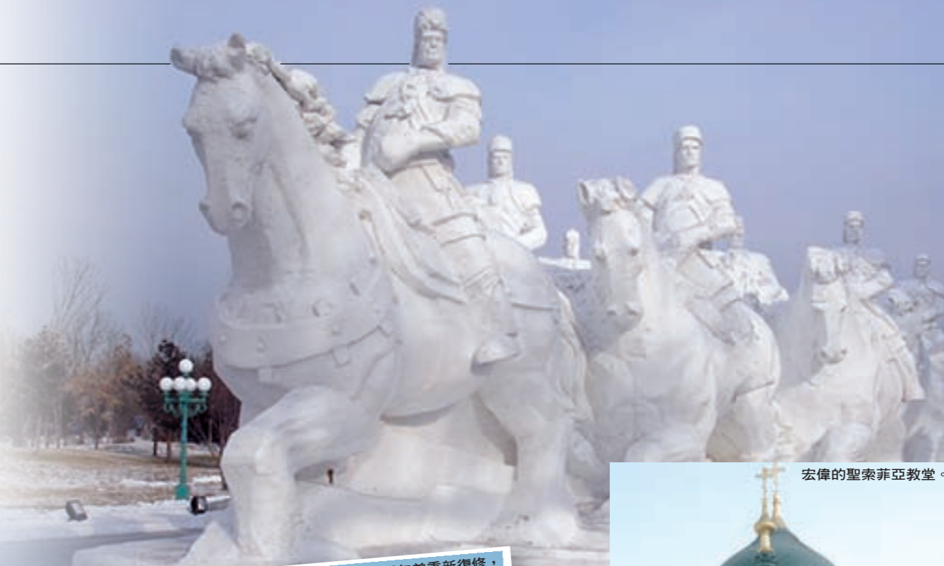
製作中的冰雕及雪雕。

中國幅員廣大，我們位處極南方的香港，習慣了溫暖氣候，一下子飛到極北的黑龍江省，對南方人確是頗大挑戰。然而在香港一世也不會見到雪景，又怎可不到冰雪之都遊覽一下，領略冰天雪地的美妙與刺激？何況氣候暖化危機言之鑿鑿，不趁早到黑龍江省看冰雪，再過數十年可能要到兩極才看得到。黑龍江省乃是中國最北的省份，與俄羅斯接壤，充滿異國風情，省內除了流經中國、蒙古、俄羅斯三國的黑龍江，還有著名的松花江，冰雪之外亦甚具旅遊價值。