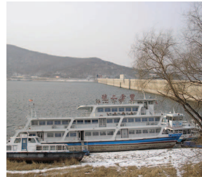
吉林的松花江畔，冰風凜凜，冷得人心曠神怡。