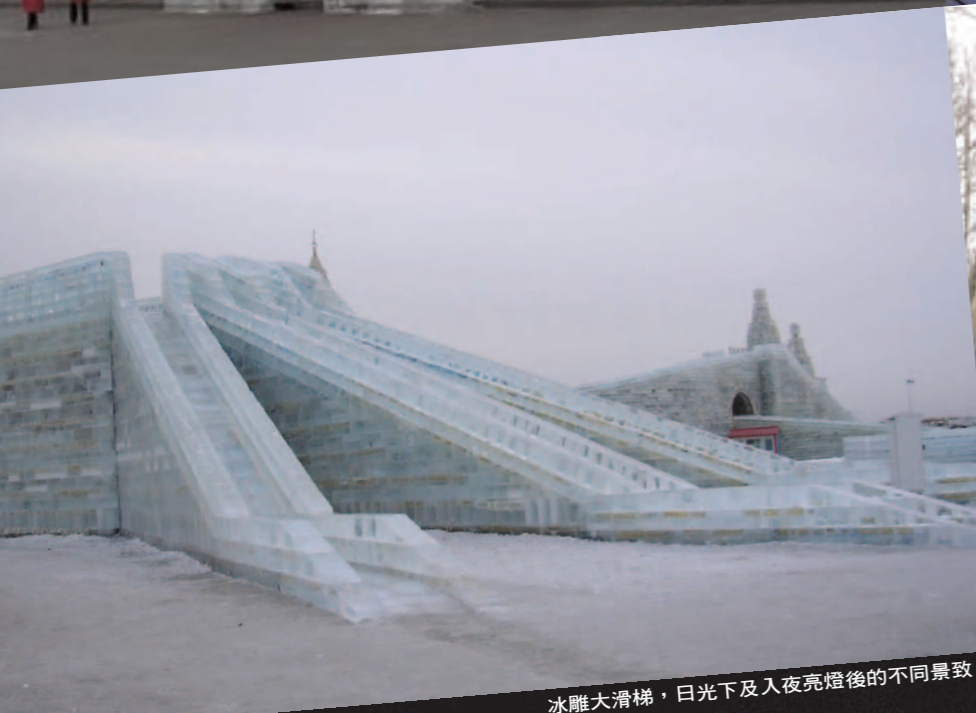
冰雕大滑梯，日光下及入夜亮燈後的不同景致。