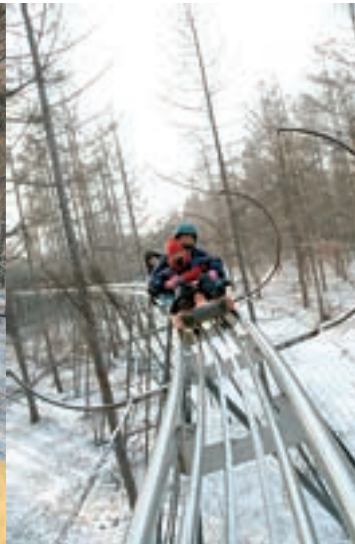
下山專用的滑行車。

然而，重點節目當然是冰雪大世界，約三時到達便最理想，因為四時入黑，早些去到可清楚見到日光下的冰雕，更可見到當地人製造冰雕的情景。冰雕入黑後會亮燈，七彩紛呈，又是另一番風味。巨型冰滑梯真的可供人滑下，非常好玩，加上其他壯觀冰雕，令遊客樂而忘返。