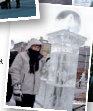
在街頭，小型冰雕隨處可見。