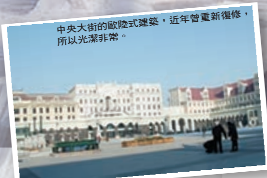
中央大街的歐陸式建築，近年曾重新復修，所以光潔非常。